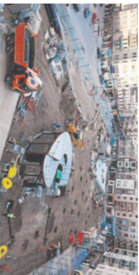
Obres Plaça Ricard Vinyes (5-03-2010)

Des del nostre Grup Municipal, hem fet un seguiment de les obres d'aquesta plaça. Hem recollit nombroses de les vostres queixes pel que fa als canvis i rectificacions de l'obra, creació de desnivells i mala visibilitat a més d'un agressiu impacte visual amb tot el que això comporta de perillositat urbana. Sabem perfectament que aquestes obres han suposat perjudicis prou importants que afecten a la qualitat de vida del barri i sobretot, al desenvolupament de l'activitat